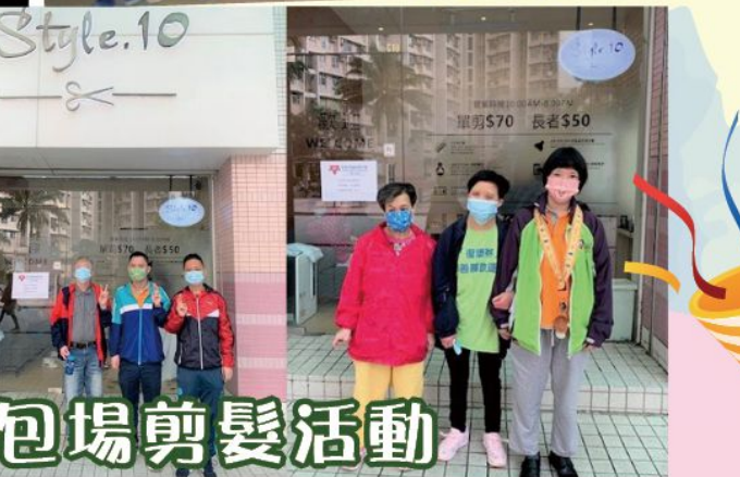
疫情下宿舍包場剪髮活動